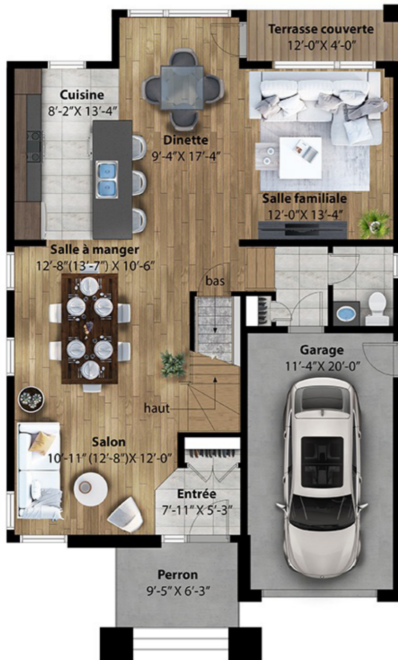
REZ-DE-CHAUSSÉE Superficie RDC : 1 000 pi 2